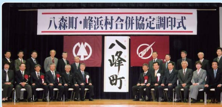
調印後の来賓及び協議会委員