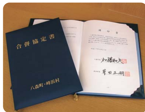
両町村長により署名された 合併協定書

平成17年3月24日八森町議会、峰浜村議会、合併に関する4件の議案が議決されました。